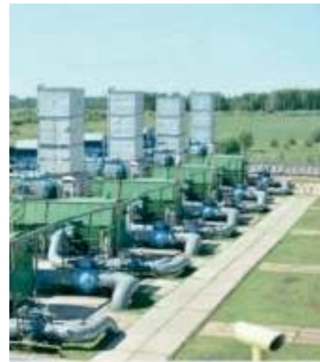
OIL & GAS